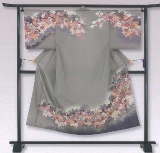
花鳥図シリーズ 香梅

ちりめんのような風合いのやさしい生地に、 日本ならではの美しい風景が豪華に表現された一着です。 高級で上品さに満ちた一生を感じさせるデザインは、きっともの人にお似合いです。