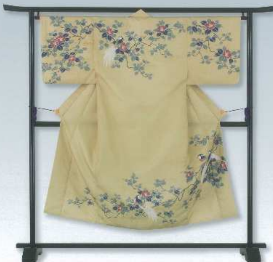
花鳥図月シリーズ つがい椿

冬の真っ白な風景にひっそりと咲く椿。 その傍らに佇むのは、つがいのオナガドリ。 いつも隣にいてくれたかけがえのない方に、感謝を込めてお贈りしたい一着です。