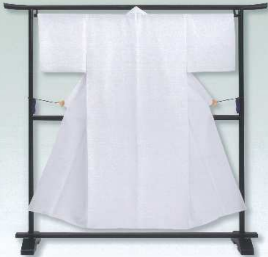
しょうけんはふたえ 正絹羽二重

天然の絹だからこそ実現した風合いと光沢は、他を寄せ付けない上質さです。 大切な方には、最高のものをお着せしたい… そんな願いから生まれた仏衣です。