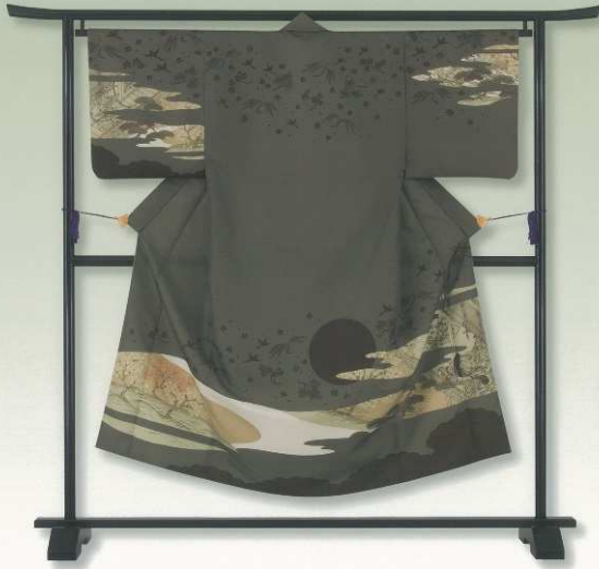
花鳥風月シリーズ

雲間から覗く物語は、永遠に続く思い出を。 満ちてはかける月の様は、人生の機微を表現している至極の一着です。