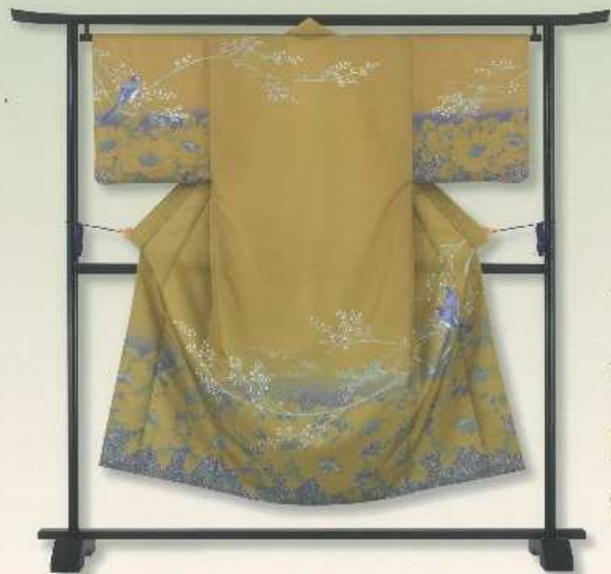
花鳥図月シリーズ つがい牡丹

夏の日々に咲き誇る牡丹は、着る人の高貴さと仕立さを表現しています。 つがいの椋鳥で愛情を表現したデザインは、長年連れ添った大切な方に贈りたい一着です。